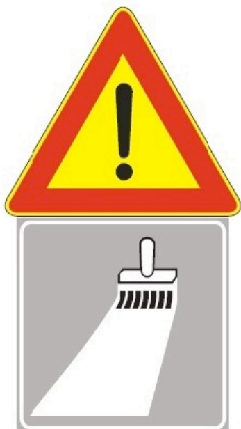
Figura II 391 Art. 31